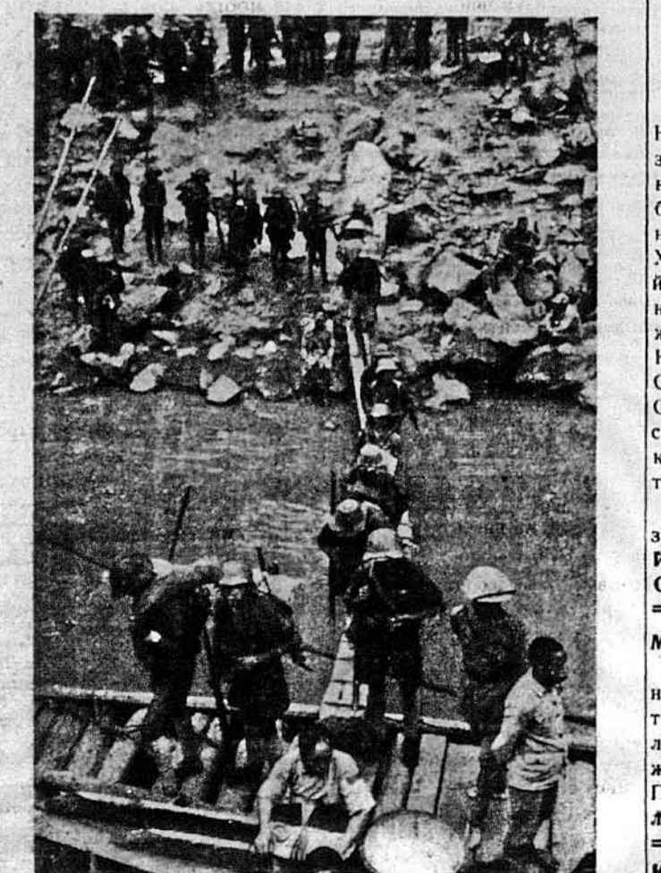
ВІДХІД НА ФРОНТ.—Китайські вояки, переняті западом вояками з найзником батьківщини, всідають на примітивний човен, що повезе їх гори рікою Янцзе на зустріч з японцями. Там ідуть завзяті бої, і їх товариші кінчуть допомогти.