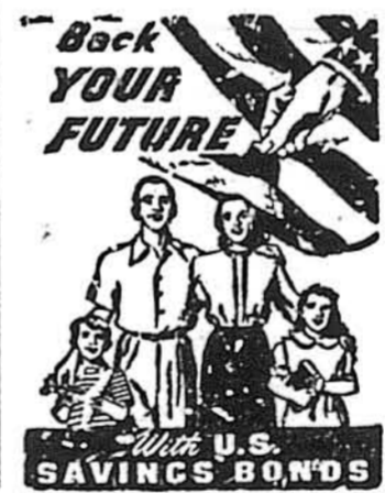
Back Your Future U.S. Savings Bonds

Але нєреальність того, чого він учився, розчаровувала його і він ставав змучений від цього нового змагання. Він не покидав науки головно тому, що все життя він не покидав важкої праці, хоч і не відчував у нїй ніякої примєстности. Та під осїнь другого року цього ексцентричного життя він уже більше не вїрив у те, що піде у коледж. І тоді один рухливий, низький купець затримав його на вулиці в Джєрралємоні і запитав голосно про його студїю в вїтїху цікавої товпи, що волачїлася там на перехрєстї, під готєлем. Кнут замовчав, але був небезпечно злий. Він вчас пригадав собі, як то одного разу „поклав“ свої злісні руки на ліни-