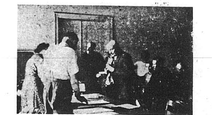
Представник ЗУАДК роздає в одному з таборів харчі українським сирітцям.

Місцевості, в яких ведуться студ. харчівні і кількість студентів, що користали з допомоги: Мюнхен-Фюріхшутле — 175 осіб; Мюнхен-Вольфгангштр. 69 — 57 проф. — 126; Ерлянген — 56; Фюрт — 20; Ульм — 123; Гайдельберг — 15; Карльсруге — 21; Франк-