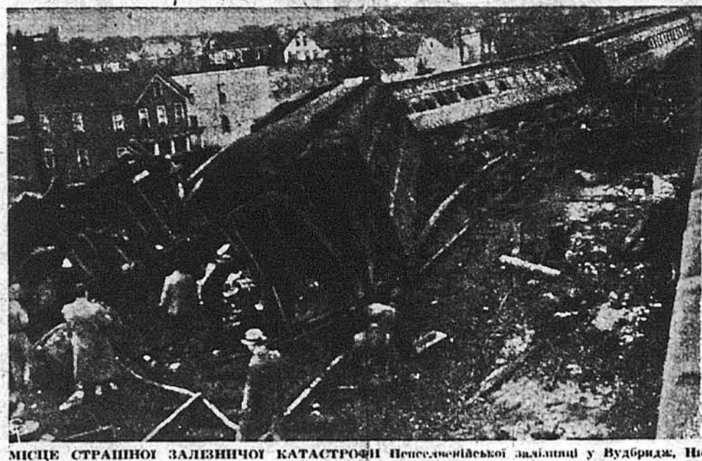
МІСЦЕ СТРАШНОЇ ЗАЛЕЗНИЧОЇ КАТАСТРОФИ Понесеної вейської залізничї у Вудбрідж, Нью Джерсі, жертвою якої вийшло 83 порочорних вїзків і поверх 500 порочорних, з того що окола 100 залишається під лікарською опікою в шпітальї.

● Новий лік, який вбиває бакилі в вірус прядатий на катар і перестуду. Це є комбінація йодину з РУР — „полівініліпиролідон“. Про нього живчати на шкіру або поковтнути. Це є винахід підприємства „Дженерал Анїлайн енд Фїлм Корпорейшн“. ● Лейд Астор приїхала з Англії до Америки з острогого, що комунїсти хочуть розбити „нарід, що вживає англійської мови“. ● Лейд Астор походить з Америки, однак вийшла замуж за англійця і була посольно в британським парламєнті. ● Недавня втрата „Марді Гра“ — перед Великим Постом в Нью Орліє. Злиивий дощ розпорочив топу, яка забавлялась на вулиць міста у вїкторю ввечір. ● Померла найбагатша жінка в світі, панї Метю Астор Вїлкс в Нью Йорку. Вона мала 80 років життя і $125,000,000 маєтку. Жила на відлюддї, хоч і в Нью Йорку. П. мати, Гетті Грін, померла в 1916 р.