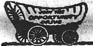
Invest in U.S. Savings Bonds