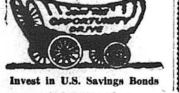
Invest in U.S. Savings Bonds