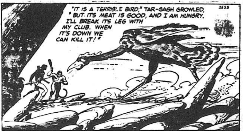
ТАРЗАН, ч. 2553. Не хоче йти відлі

„Це страшна птіца“ — заговорив Тар-Гаш. „Однакє її м'ясо добре, а я голодний. Я поломлю її ноги костуrom.“ Коли вона зійде, тоді ми її вбємо.“ Коли тварина рушила проти них, Тарзанів лук застогнав і засвістала стріла, яка прошила її груди. Випустивши другу стрілу, Тарзан відскочив набік. Великий дзюб Діяна задер його плече.