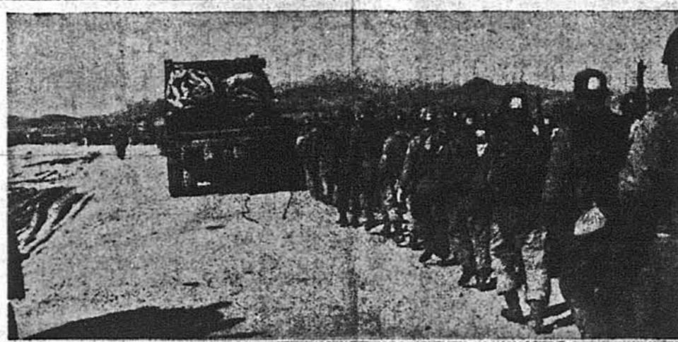
В ПОХОДИ ДО 38-МОЇ ПАРАЛЕЛІ з цей відділ південно-корейських військ, що переходять через зруйновану червоною агресією столицю сестри країни, Сеул. Паралелі є для південних корейців тільки „першим етапом“, бо визволення цієї країни аж до манджурського кордону вони вважають своєю головною ціллю в цій намішеній імперіалістичній війні.

Віче в справі докінчення переселення ситальців з Європи до ЗДА відбудеться в нещода 8 квітня в Нью Йорку старіями Українсько-Переселенного Осередку в Самюелі. Подробці будуть проголошені окремо. Порто Ріко обіцяє постачати 50-100 тисяч робітників до стейтів. (Портрикти надаються спеціально до фармерських сезонних робіт.) Примусову брамку до війська можна перемістити на загальний військовий вишкіл упродовж 18 місяців, ствердить Карл Вінсон, голова конгресової комісії збройних сил. Давніше панувало переконання, що на це треба цілих років часу. Ліжка в військових шпиталях для шкідливих дітей відступати втерани, щоб їх врятувати від наслідків захворювання наркотики, як мариуанування і опію. Це виявила влада на переслуханні конгресової комісії при складанні бюджету для Прилюдної Служби Здоров'я. Маргарет Труман, дочка президента, підписала контракт з Нешнел Бродкестінг Компані для своїх виступів в радіопрограмах. Платня, як кажуть, більша ніж її батька.