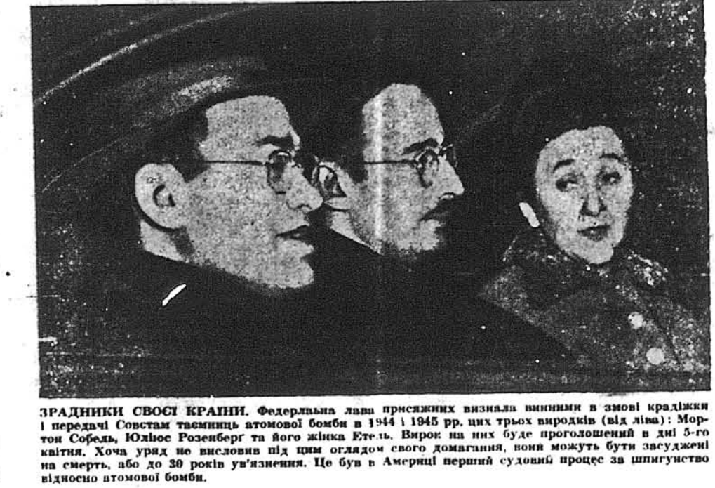
ЗРАДНИКИ СВОЄЇ КРАЇНИ. Федеральна лава присяжних признала винними в змові крадіжки і передачі Совстам тисиниць атомової бомби в 1944 і 1945 рр. цих трьох шпигів (зліз ліва): Мортон Собел, Юліус Розенберг та його жінка Етель. Вирок на них буде проголошений в дні 5-го тижня. Хоча уряд не висловив під тими оглядом свого домагання, вони можуть бути засуджені на смерть, або до 30 років ув'язнення. Це був в Америці перший судовий процес за шпигунство відносно атомової бомби.

● Совєтський командант в Бердлі викинув протест західних командантів проти двох стрілів комуністичного поліцита в автобусі західних прогульовців. ● 83,525,000 осіб вносило населення Японії в 1950 році. ● В Загребі і Спалт в Югославії закрито два совєтські консуляти, хоча не повідомлено, чи це зроблено на домагання югославського уряду чи з власної волі Совєтів. ● 1,066 комуністів заарештували індійці під час поліційної і військової акції проти комуністичних заворушень в районі Камруп впродовж останніх двох місяців. ● Норвегія і Голандія рішили злучити свої зусилля і досліди над розвитком атомової енергії.