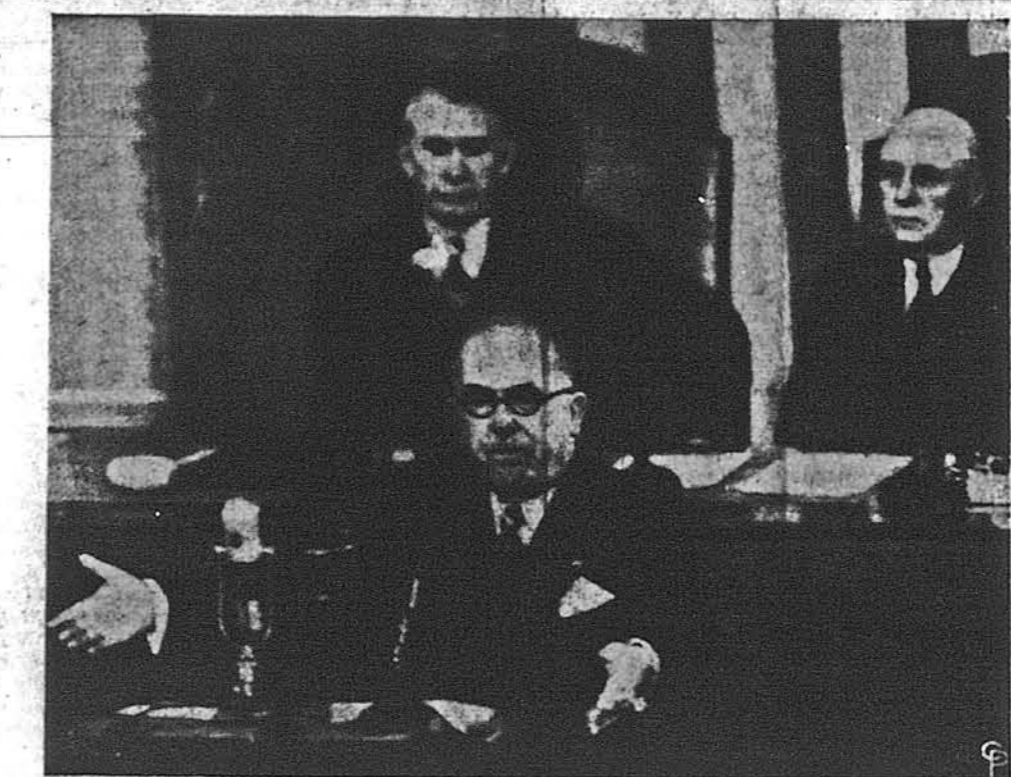
ПРЕЗИДЕНТ ФРАНЦІЇ, ВІНСЕНТ АУРІОЛ, висловився перед спільною сесією Конгресу у Вашингтоні, висловлюючись проти нейтральності та ізоляціонізму, вважаючи їх „абсурдним і історичним нонсенсом“. За Оріолом сидять заступник президента Баркл і спікер Палати Репрезентатів, Сем Рейборн. Сенатори і конгресмени алаштували Оріолові велику овацію.

Секретар скарбу, Джан В. Снайдер, повідомив Конгрес, що на біжучий рік треба тільки десять біліонів нових податків, щоб зрівноважити приходи з видатками на оборону. Зменшення в податках стало можливе тому, що в біжучім фискальнім році заощаджено досі понад три біліони. Снайдер однак повідомив, що наступного року треба буде підняти податки на шість з половиною біліона доларів.