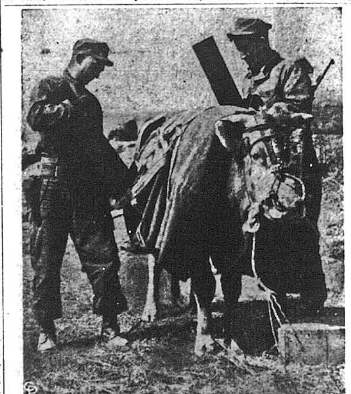
„ТУВИЛЬЦІЙ ТРАНСПОРТ“, що його використовуют американські воїни в Кореї тоді, як іншого немає під рукою.