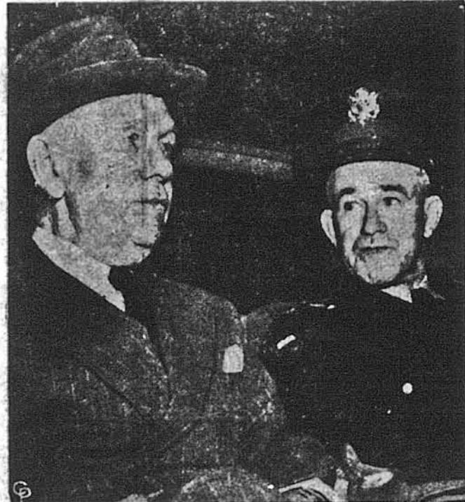
СЕКРЕТАР ОБОРОНИ, ГЕН. МАРШАЛ, І ГОЛОВА ОБ'ЄДНАНИХ ШТАБІВ, ГЕН. БРЕДЛІ, в дорозі з Білого Дому, де вони минулої суботи відбули таємні наради з президентом Труманом, правдоподібно в справі дисциплінарної акції проти ген. Мек Артура за його самовільні політичні виступи.