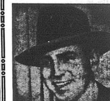
Нова весняна мода в різних кольорах.