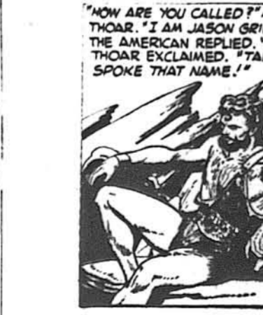
"NOW ARE YOU CALLED?" ASKED THOAR. "I AM JASON GRIDLEY, THE AMERICAN REPLIED. "JASON," THOAR EXCLAIMED. "TARZAN SPOKE THAT NAME."

Українське перевозове бюро В. Е. Богачевський. Tel. OR. 3-2484 208 E. 6th ST., NEW YORK 3, N. Y. Перевіз меблів, багажу і ризних речей.