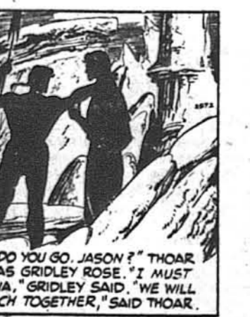
"WHERE DO YOU GO, JASON?" THOAR ASKED, AS GRIDLEY ROSE. "I MUST FIND JANA," GRIDLEY SAID. "WE WILL SEARCH TOGETHER," SAID THOAR.

„Як тебе називати?“ — запитав Тор. „Я називаюся Язон Грідлі!“ — відповів американець. — „Язон? Таж то Тарзан згадував таке ім'я!“