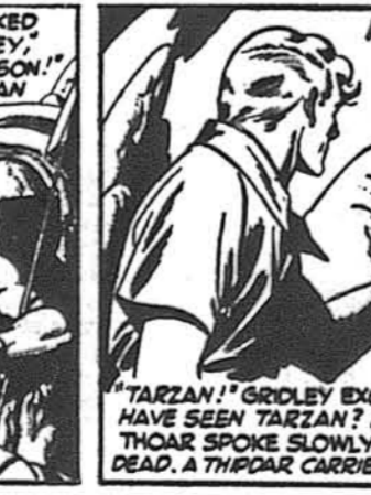
"TARZAN!" GRIDLEY EXCLAIMED. "YOU HAVE SEEN TARZAN? HE IS ALIVE?" THOAR SPOKE SLOWLY. "TARZAN IS DEAD. A THIPDAR CARRIED HIM AWAY."