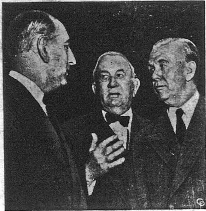
„РІШАЛЬНІ УДАРИ“ в Кореї можуть заставити комуністично-китайських агресорів до мирових переговорів — заявив вчора секретар оборони, ген. Джордж Маршал (зправа) в четвертому дні своїх свідчень перед сенатськими комісіями. На фото: ген. Маршал під час перерви розмовляв зі сенаторами Річардом Росселом (ліва) і Тамом Коналем.

Вашингтон, 10 травня. Секретар оборони Джордж К. Маршал заявив, що Злучені Держави ніколи не відступлять від постанови, щоб не допустити комуністичних китаїців до посади члена Формози ані як члена Об'єднаних Націй. У четвертому дні переслухання в Об'єднаних сенатських комісіях збройної служби й закордонних справ над причинами, які довели до звільнення ген. Доглеса МекАртура зі становища верховного командувача на Далекому Сході, Маршал признав, що на випадок несподіваного вибуху світової війни, якась кількість російських бомбардувальників могла б пролетіти через оборонний перстень і нанести великі шкоди американському населенню. Під суворими допитами республіканських сенаторів Маршал заявив в найсильніших висловах, що Злучені Держави ніколи не згодяться на допущення комуністичного Китаю до Об'єднаних Націй. Коли його запитали, чи Америка використає своє право вето проти того, він заявив, що це його „рішуче враження під теперішню пору“.