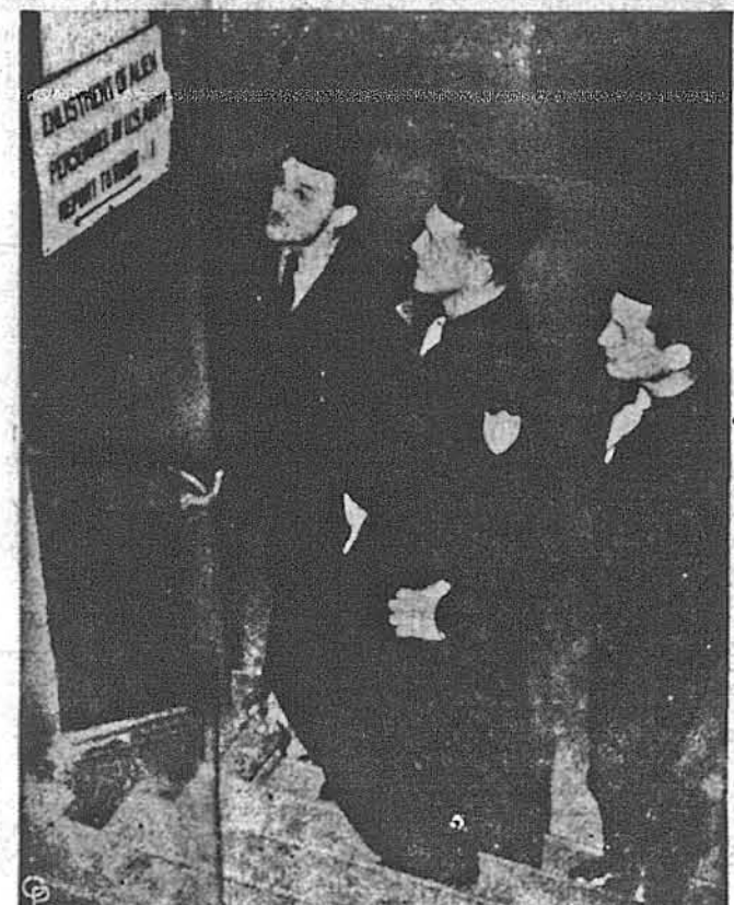
ПЕРШІ ТРИ ЧІЖИНЦІ, ПРИНЯТІ ДО АМЕРИКАНСЬКОЇ АРМІЇ — це три втікачі з країні за залізною заслоною: лотис, естодець і полк. Іх приймано в рекрутаційному центрі у Франкфурт, Німеччина, на підставі ухваленого Конгресом закону, що дозволяє Армії вербувати 2,500 вояків з-поміж Д.П. в Німеччині.

Дев'ять біллонів дол. на газетних оголошеннях видадуть до кінця року різні підприємства і одишні, якщо газети будуть доставати оголошення до кінця року в такій кількості, як досі. Це виявив Фредерік Р. Гембл, предсідник Американського Товариства Агенції для Оголошень, на обіді в Клубі Сдл.