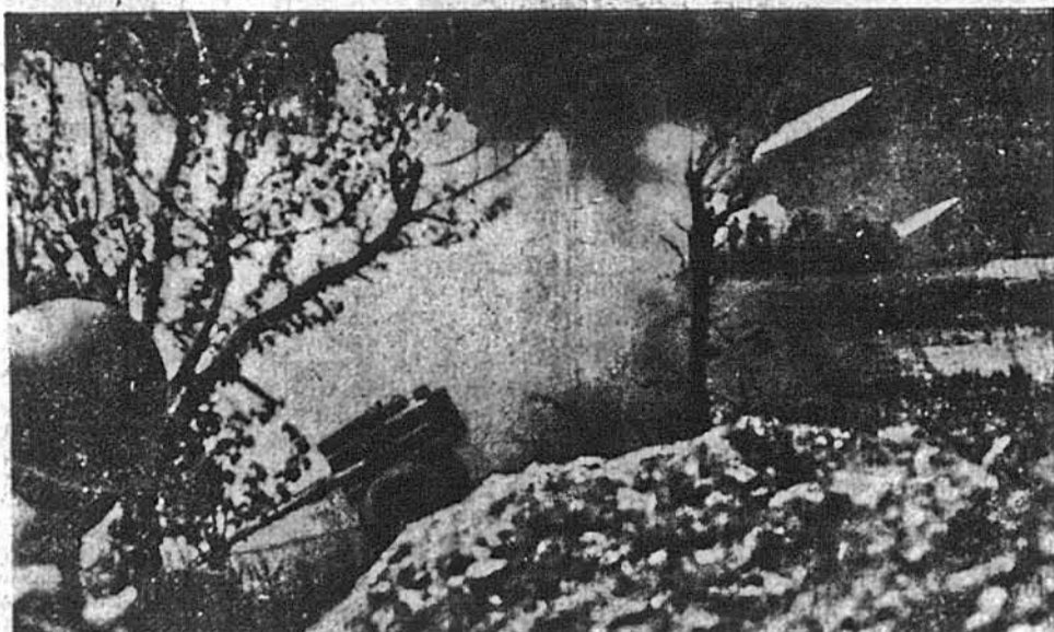
ПЕВЛО ДЛЯ ЧЕРВОНИХ НАПАСНИКІВ В КОРЕЇ створив модерні американська зброя, до якої належать ракети, що вигонені кометами розоронують ворожі лінії. Завдяки індійській силі цієї зброї червоні маси показались безсилі в усіх своїх намаганнях „скинути американця в море“, втрапивши самі в дотеперішніх боях вже майже мільйон воїнів.