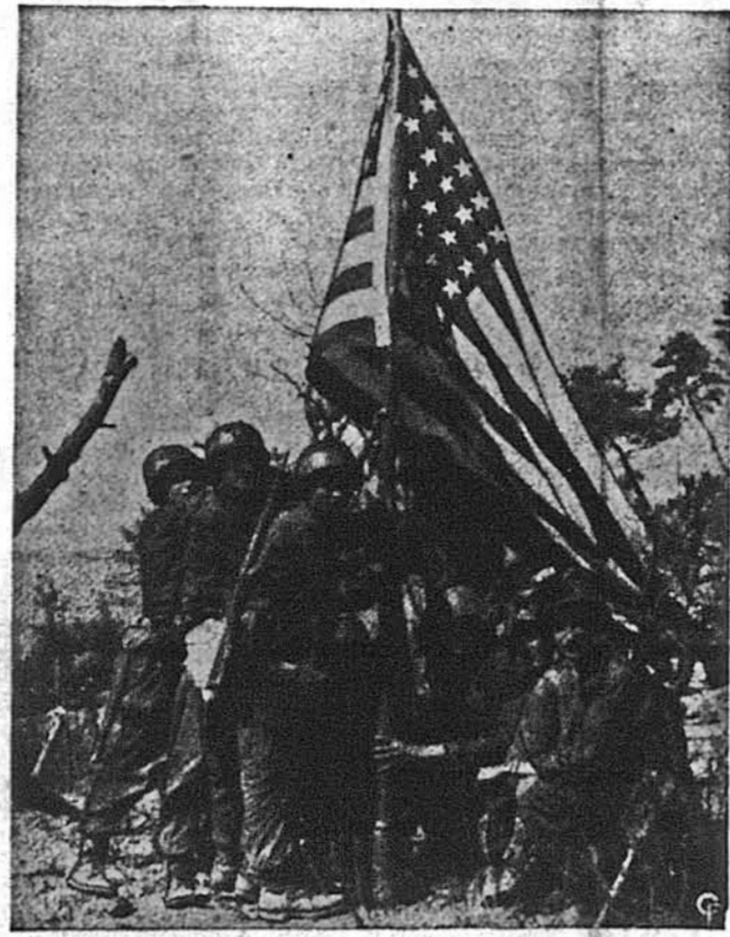
О, скажи, що наш прапор ще там... Війдя американських воєнків в Кореї відноситься „Стару Славу“ на одному з вершин, тільки зобутому в битві проти червонок. Група цих переможців з прапором дуже нагадує відому картину з Іво Джима з другої світової війни.