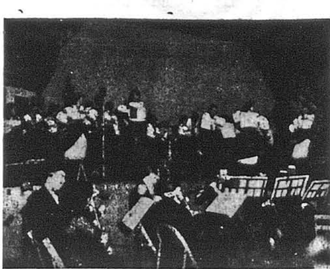
ОПЕРА „ЗАПОРОЖЕЦЬ ЗА ДУНАСМ“. Танці у виконанні ансамблю Українського Професійного Театру. До вистави цієї опери Українським Проф. Театром в Ньюарку в Wideway Hall (проти City Hall), 929 Broad St., у суботу, 14. липня, в 8. год. вечорі. (голот.)

ПРИ ЗМІНІ МЕНШАННЯ В НЬО ЙОРКУ АБО ПЕРЕСЕЛЕННІ ДО СТЕТТІВ: NEW YORK PENNSYLVANIA NEW JERSEY CONNECTICUT КЛІНІЧНЕ УКРАЇНСЬКЕ ПЕРЕВОЗОВЕ БЮРО В. Е. ВОГАЧЕВСЬКОГО 208 EAST 6th STREET, NEW YORK 3, N. Y. — TEL. OR 3-2484