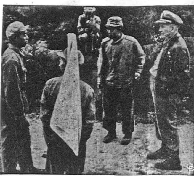
ВІЛЯ КАЕСОНГУ СПОКІВ, а комуністична сторожа без зброї, згідно з вимогою ген. Меттью Ріджеса, начальника командира альянських збройних сил, що домагася демілітаризації Каесонгу і округи.

Імя _____ Адреса _____ Місцевість _____ Стейт _____