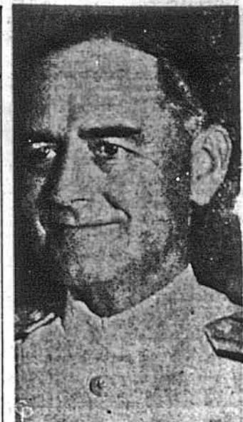
ВИЩЕ-АДМІРАЛ ЛІНДЕ МЕРКОР-МІКІК зліва по смерті адмірала Форталі П. Шермана тимчасовим начальником командиром Морських Оперцій.

Професори університетів в Толідо та Нью Бронсвік, Голова Американізм-Комітету в Огайо, редактор газети в Толідо, керівник комерційної палати в Толідо, ректор університету в Толідо, професор кolumbійського університету і багато інших визначних осіб хотіли б мати літературу про Україну. Гим особам вже частково вислані такі книжки, як Маннінга „Україна 20 сторіччя“, „Історія Української Літератури“ (вид. У. Н. С.), М. Приходька: „Комунізм у дійсності“, „Московський наступ для звітового панування“, а також „Українська закордонна політика У. Н. Р.“ та інші. Немало із переліченої та іншої літератури вже передано мною на руки учасникам багатьох конференцій та зустрічей в різних стейтах ЗДА, а створення книжкового фонду на ці потреби ожоче підтримати Пан Американський Комітет і УСК. Прикро відчувати на кожному кроці брак української літератури в англійській мові, художньої, публіцистичної і наукової. А як багато наша батьківщина на хвилюючи для сучасного світу теми, що давно чекають на перо літератора чи науковця. Розглядаючи каталоги кількох — як публічних, так і університетських бібліотек у різних стейтах ЗДА, а з великою досадою відмічав суцільний факт — брак української книжки, але натомість вороже наставлено