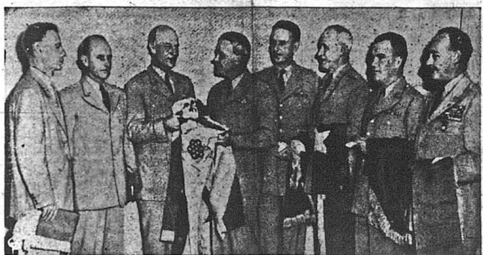
ЗАМІТНА ВИПІСЬКОВА ВРОЧИСТІСТЬ відбулася в Пентагоні у Вашингтоні, з нагоди підвищення військовим генералам в їхніх рангах на одну літеру. Генералам передано літери і прапори. На фото (від ліва): ген. В. Бедла Сміт, керівник Центральної Розвідної Агенції; ген. Алфред М. Грінтер, шеф штабу альянтського командування в Європі; ген. Джан Гул, заступник шефа штабу; ген. Лотон Коллінс, шеф штабу Армії, під проводом якого й відбувалася вчорашня церемонія; ген. Максвелл Д. Тейлор, заступник шефа штабу для дій і адміністрації; ген. Люїс Нік, шеф інженерних частин; ген. Антоні МекОліф, асистент шефа штабу, та ген. Джеймс Філіппс, заступник асистента шефа штабу.

легчі роди атомової зброї” ніж атомові бомби. Можна догадуватися, що під цим треба розуміти винахід атомових гармат, які виробовано в Неваді цього року. Комісія жадає про поступ у новому атомовому заводі в Савт Каролайні (завод той займає 250,000 акрів землі). Панає загальна думка, що там підготовляють виріб водневої бомби й розвивають далі атомову силу. Крім того, обговорюються в звіті досвіди в Неваді, у стеїтї Небраска і на острові Еніветок, на Тихому океані. Там випробували атомову бомбу вбагато разів сильнішу ніж та, яку скинули на Гірошіму й Нагасакі в Японії. Крім того, говориться про значення радіоактивних ізоотопів для медичного вжитку.