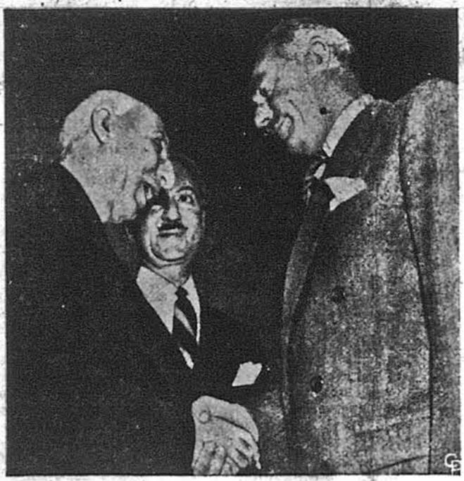
ІРАНСЬКИЙ ПРЕМ'ЄР У ВАШИНГТОНІ. Державний секретар Дін Ачесон (зправа) вітає на Юніон Стейшен в столиці Іранського прем'єра (зліва), що скористав зі свого побуту в Злучених Державках, де виступав в обороні Іранського ставовища в шифтовому конференті з Британією перед Радою Безпечки ООН, та відвідав президента Трумана й з ним та іншими членами американського уряду відбув розмову, прохачи американської підтримки в цьому конференті. На фото посередні: Іранський амбасадор у Вашингтоні, Назарога Ентезам.

узяти відпустку з військової служби і прийняти становище амбасадора. Таке поступування мав на увазі президент, згодожуючи призначення генерала Конгресові в останній хвилині перед закінченням конгресової сесії, однак Конгрес уже не мав часу для полагдження цієї заплутаної справи. Крім звільнення генерала від діяння закону з 1870 р. має сенат затвердити його на становище амбасадора. З уваги на завязті протести різнородних осіб і груп, головню протестантських, призначення ген. Кларка на першого амбасадора до Ватикану буде важкою справою для Сенату.