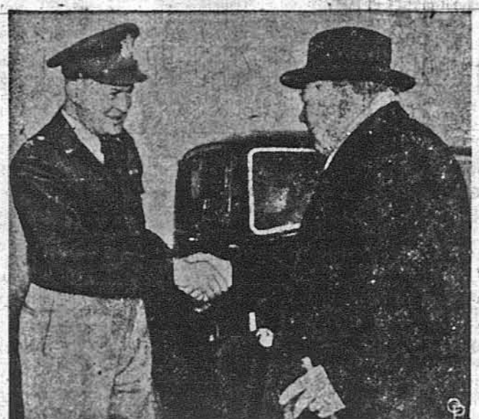
СТАРИ ПРІЯТЕЛІ і головні архітекти альянтської перемоги в другій світовій війні, альянтський головний командант в Європі ген. Даят Айзенгауер і британський президент Вінстон Черчилль, зустрілися знову на „старому побаченні“ під час теперішніх відвідин Черчилля в Парижі. З поінформованих кол повідомлено, що ген. Айзенгауер потім зрештешуватиме зі своєю політичною кар'єрою і кандидатури на президента Злучених Держав та залишиться на пості в Європі, якщо Англія приєднеться до планованої єдиної європейської армії.

які є в моєму розпорядженні в цій справі“. Тим часом з Пیتсбургу повідомляють, що сталеві промисловці не хочуть поступитися і підвищити платню робітникам більше як на 6 центів, а юнія не хоче відступити від своєї вимоги підвищити на 15 ц., крім інших точок. Тому навіть серед найсприятливіших настрій страйк передбачений і він може позитивно найменше тиждів. Бюро Стабілізації Цін у Вашингтоні не має наміру дати дозвіл на підвищення цін стали понад те, що передбачує закон. Директор Бюро Майкел ДіСал каже, що „ми не можемо окуплювати мир у сталевій промисловості неоправдану підвищеною ціною“.