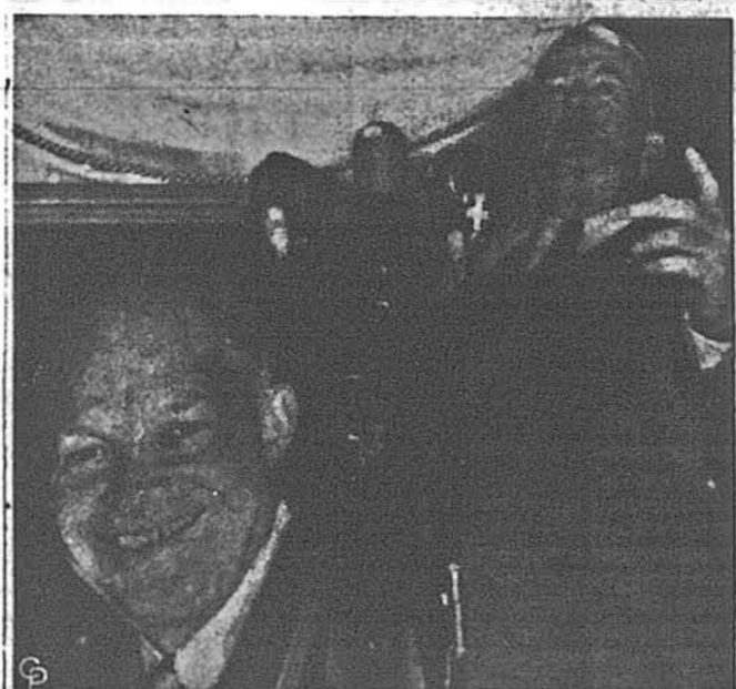
ГОЛОВНУ КВАРТИРУ КАНДІДАТУРИ АНЗЕНГА-ВЕРА НА ПРЕЗИДЕНТА відкрив сенатор Джеймс Дофф, республіканець з Пенсильванії, у Вашингтоні. На фото: сенатор Дофф виходить з інавгураційної промови до кореспондентів.