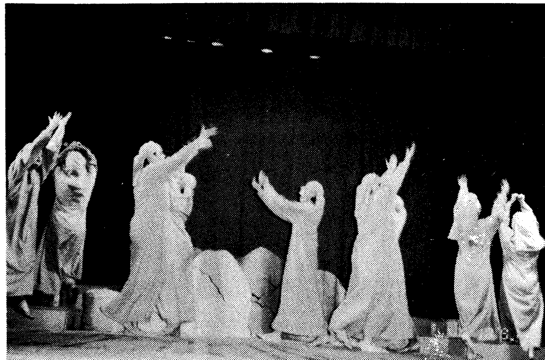
Сцена з інсценізації „Івана Вишневецького“ І. Франка у виконанні „студійців“.