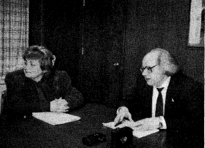
Марія і Іван Драчі під час розмови в УНСоюзі.

Джерзі Сіті, Н. Дж. (П. Часто). Хоч наша діаспора діаспора сьогодні й не знає інформаційного голоду щодо життя в Україні, все ж далеко не завжди вдається задовольнити читачів ідеальними пропорціями у поданні відомостей, — щоб було присутнє загальне тло, так би мовити, погляд згори, і водночас висвітлювалися б окремі деталі, зберігався б „смак і запах“ життєвої конкретики. Й ось таку рідкісну можливість працівники редакції „Свободи“ і „Українського Тижневика“ дістали під час зустрічі з одним із найбільш відомих українців у світі — Іваном Драчем і його дружиною Марією.