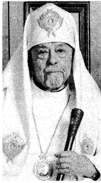
Патріарх УАПЦ Мстислава

З цієї нагоди Святіший Мстислав, Патріарх Київський і всієї України, тепло передає не лише свої особисті побажання, але також від усіх єпископів, священників і вірних Української Автокефальної Православної Церкви в Україні, ЗСА, Південній Америці, Західній Європі, Австралії і Новій Зеландії. Закінчується лист побажаннями, щоби Гос-