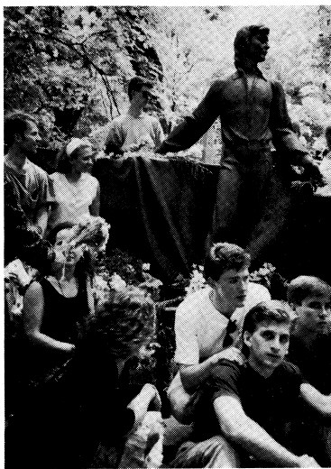
Група на зроби В. Івасюка у Львові.

— А як сприймали зустріч з Україною молоді ваші танцюристи? Більшість із них була вперше в Україні, всі повернулися захоплені, нові ентузіазми, і це торкається не лише українців, а і цих несласних чужинців, що працюють у нашому ансамблі. Справді не можуть ні трішки нарікати, діти жили, гармонійно співпрацювали, були здисциплі-