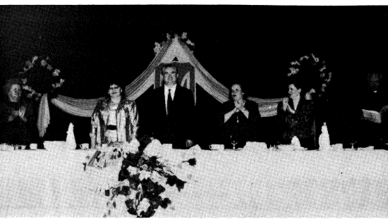
Вітають амбасадора О. Білоруса

креслив, що метою України є вільна ринкова економіка, закрена в сильній сітці приватних підприємств. Україна пильно обсервує успішні західні бізнесові та економічні моделі і на цих взірцях будуватиме свою економічну структуру. Закликав він українську діаспору прийти з допомогою „моєго брата“, тільки ринковим партнером світового ринку. Україна має на це всі дані: великі природні ресурси, багатства та молоді демократичні устрій.