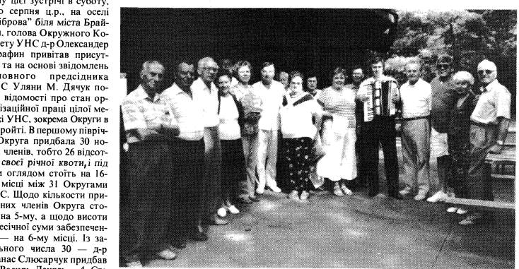
Частина учасників зустрічі